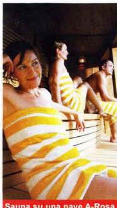
Sauna su una nave A-Rosa

Monoprodotta la proposta I Viaggi di Atlantide: soggiorno sull'isola portoghese di Porto Santo, "meta esclusiva del t.o. per il mercato italiano. L'acqua e la sabbia dell'isola hanno riconosciute proprietà benefiche che vengono sfruttate nell'ambito dei trattamenti di benes-